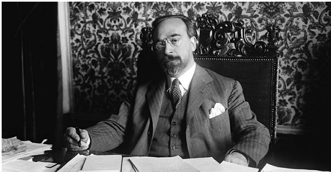
William Morris / Dominio público