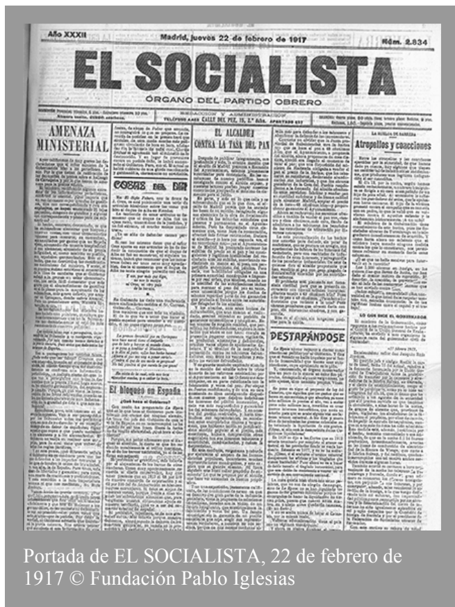
Portada de EL SOCIALISTA, 22 de febrero de 1917

Ayer calificamos de muy graves las declaraciones que el señor ministro de la Gobernación hizo a los periodistas. Lo son. Por lo que tienen de ratificación de las denuncias de prensa sobre el hallazgo de Cartagena y por lo que tienen de amenaza para la prensa misma. El ministro, rectificando algunos extremos de las informaciones periodísticas, confirmó lo esencial. ¿Qué importa que en vez de cuatro cajas grandes de gasolina, una con correspondencia y otra con explosivos, se hayan encontrado 31 cajas pequeñas, ninguna de gasolina y algunas con correspondencia...