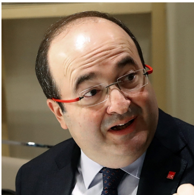
El primer secretari del PSC, Miquel Iceta