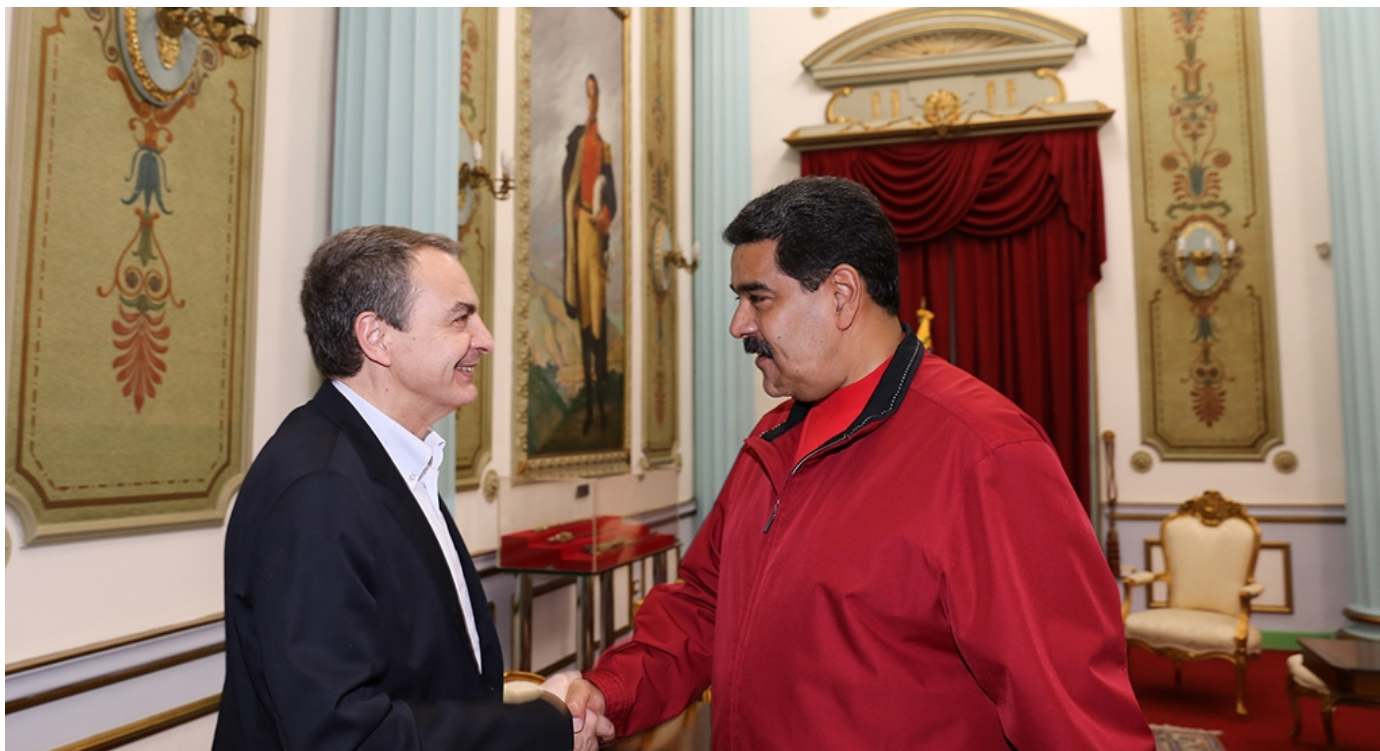
Nicolás Maduro (d), saludando al exjefe del Gobierno español José Luis Rodríguez Zapatero (i)